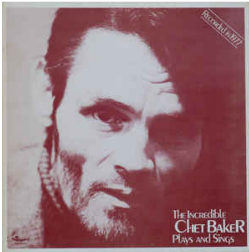
Figure 4: Chet Baker Sextet, The Incredible Chet Baker , 1977