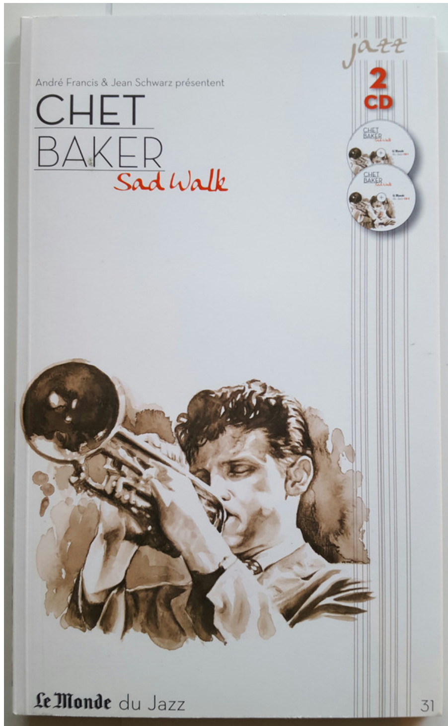
Figure 7: André Francis & Jean Schwarz présentent : Chet Baker, Sad Walk , 2009