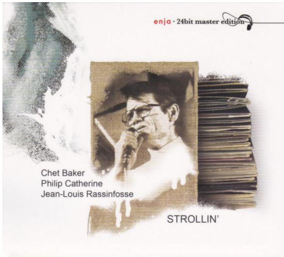
Figure 6: Chet Baker Trio, Strollin' , 1986