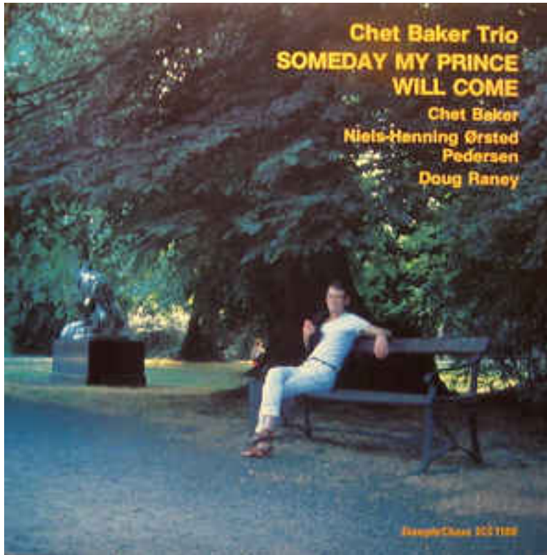
Figure 5: Chet Baker Trio, Someday My Prince Will Come , 1983

commencer au milieu du 2e A. Et pour Doug, soyez attentifs à son dernier A, entre 4'50 et 5'00. Une pure merveille de fin de chorus, harmoniquement et rythmiquement. @ demain