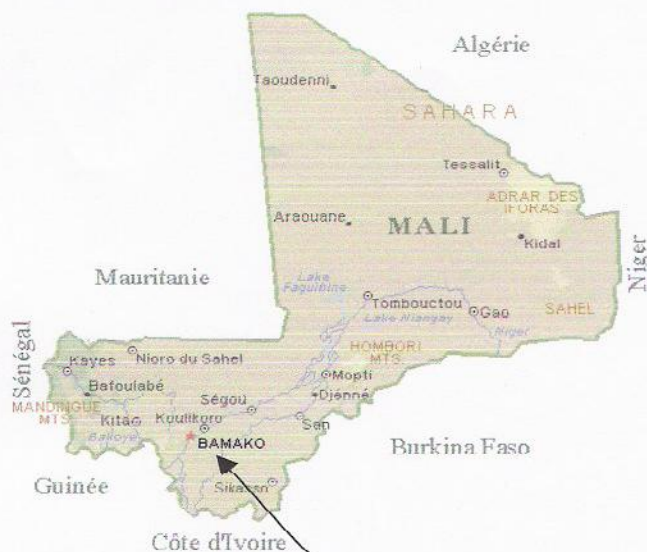
Région où se situent les huit villages

Nos actions ont porté essentiellement sur les problèmes rencontrés dans les domaines de la santé, l'éducation et le maraichage