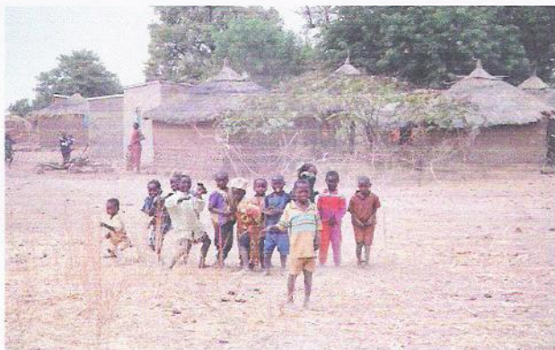
Au village d'Hérèmakono