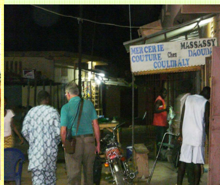
En soirée dans une rue de Nioro du Sahel

Aujourd'hui, avec plus de 1300 branchements, la moitié de la population de Nioro bénéficie de l'électricité.