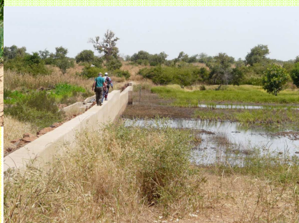
Exemple de barrage sur la commune de Sandaré

BARRAGE sur la FAKA, rivière de Nioro du Sahel, qui permettra de réalimenter la nappe phréatique et d'approvisionner les puits des jardins maraîchers. Etudes : 8000 € par le Comité (CojuMali) en 2009